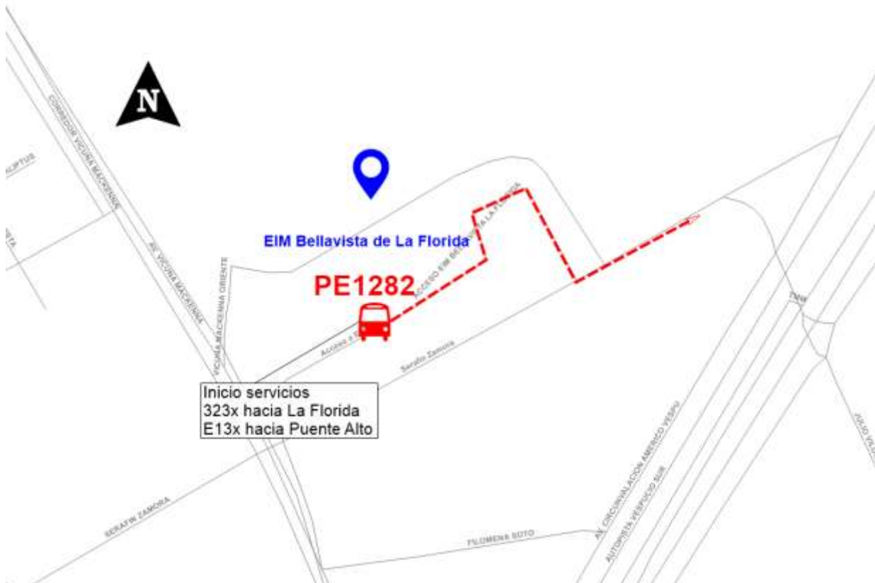
Ilustración 4. Paradas y Puntos de Inicio 323x y E13x.

Los puntos definidos como inicio de servicio serán considerados para el registro de salidas, por lo que deben ser respetados.